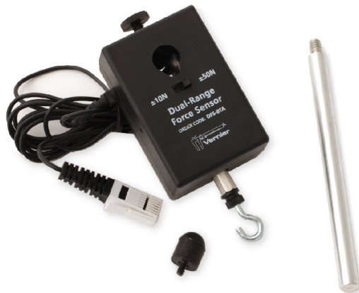
Obr. 3 – digitální siloměr Vernier DFS-BTA

Siloměr Vernier DFS-BTA [4] je opatřen odšroubovatelným háčkem, na nějž lze zavěsit závaží či jím táhnout za úchyt. V dalších experimentech budeme používat právě tento siloměr.