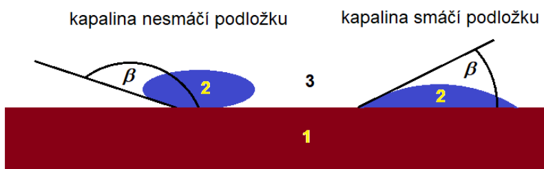
Obr. 2. Kapka na podložce.

spojnou čočku“ (čočku, která má jeden povrch rovinný a druhý konvexní). Oba zmíněné případy jsou načrtnuty na obrázku 2 (1-pevná látka, 2- kapalina, 3-plyn).