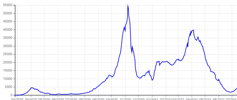
Obrázek 1: Denní nárůst počtu nakažených (7denní průměr) [1]

Vývoj pandemie covidu 19 od jejího vypuknutí do června 2021 se ve Francii rozděluje do tří vln. Na obrázku 1 vidíme graf denního nárůstu pozitivně testovaných na covid 19 ve Francii (vynášen je vždy sedmidenní průměr) – vidíme, že maximum denního nárůstu se pohybuje okolo 55 tisíc osob z celkového počtu 67,4 milionů obyvatel [2]. Maximum denního nárůstu při uvažování sedmidenního průměru se v České republice pohybovalo okolo 12,5 tisíce osob [3] na celkových 10,7 milionů obyvatel [4]. Po přepočtu na 100 000 obyvatel se tedy maximum počtu nakažených denně (ze sedmidenního průměru) pohybovalo ve Francii okolo 80 osob, v České republice okolo 120 osob.